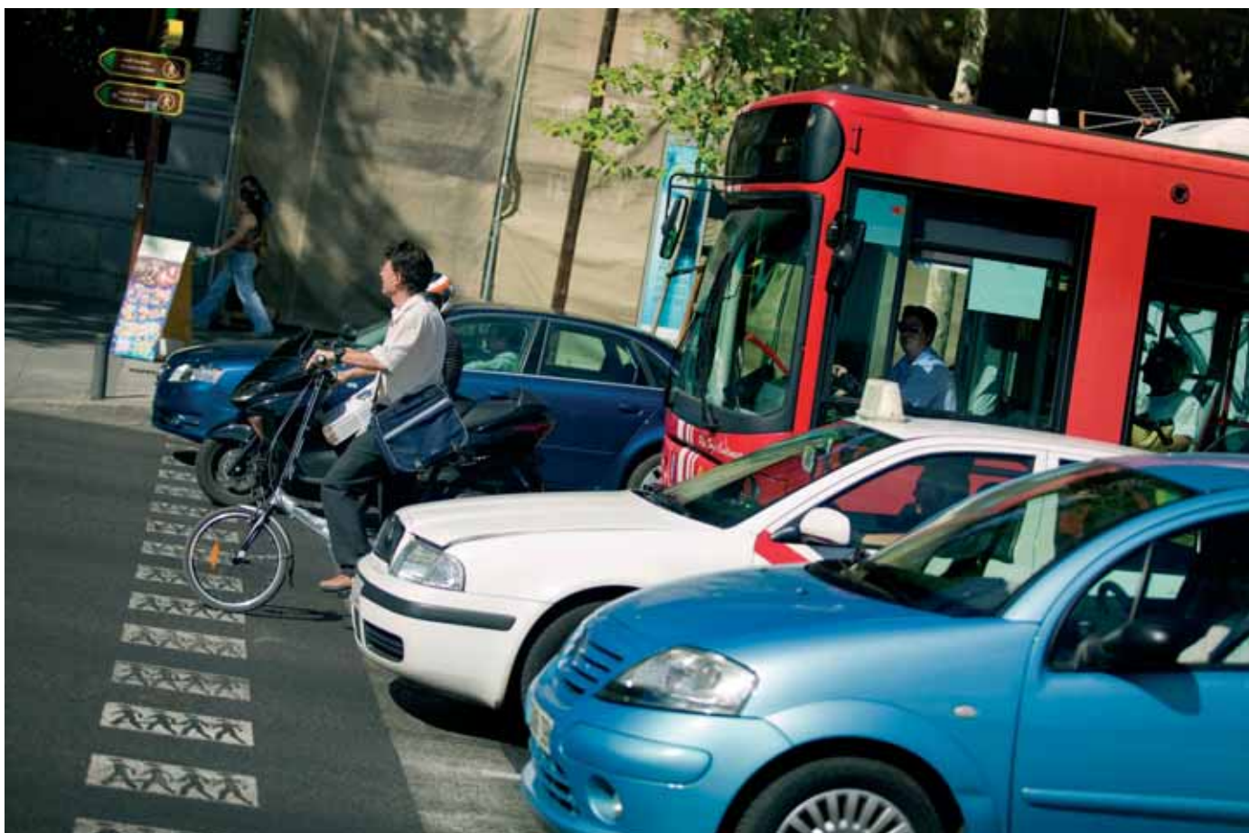
Incluso en grandes ciudades, como Madrid o Barcelona, es posible ir al trabajo en bicicleta, mejorando la movilidad y la salud.

Realizar nuestros desplazamientos habituales en bicicleta no sólo beneficia el medio ambiente y la movilidad. Pedalear habitualmente produce beneficios físicos –y lo prueban varios estudios científicos– no sólo a nivel general, sino a nivel individual. Reducción del peso, aumento del colesterol ‘bueno’, menor riesgo de infarto y enfermedades coronarias, mejora del tono muscular y reducción de los dolores musculoesqueléticos... Y todo sólo con un poco de bicicleta mientras vamos al trabajo o de compras.