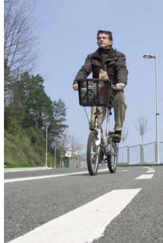
La bici, un vehículo alternativo y saludable.

La tensión arterial alta es de las enfermedades más frecuentes en la sociedad moderna. Se calcula que un 20% de la población padece hipertensión (otro 20% tiene la tensión muy alta), aunque apenas el 10-20% tiene disposición genética a padecerla. Muchas investigaciones demuestran que el ejercicio moderado previene o reduce, al menos, la hipertensión. Y aunque debe evitarse algún deporte intenso, el ciclismo reduce la hipertensión, que constituye el mayor riesgo de sufrir ataques al corazón.